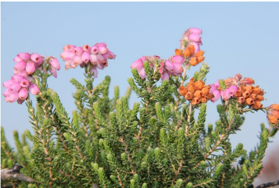
Figur 3. Klokkelyng, en meget typisk hedeplante.