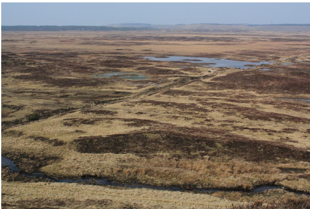
Figur 2: Udsigt over Hanstholm Reservatet.

* Tallene i dette tekststykke omfatter ikke offentlige arealer, hvor ejeren gennemfører Natura 2000-planen i egne drifts- og plejeplaner.